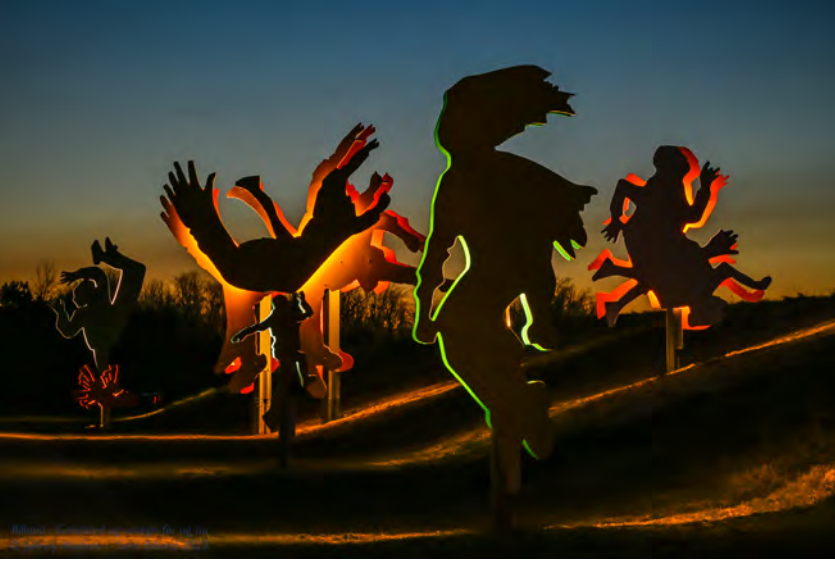
VIDEO LINK Båstlundvej imod Børnenes Hovedstad Billund http://www.creativeactions.com/wp-content/uploads/2022/01/IMG_2925.mov

"I denne digitale udgave af Sans Billund bogen kan du lege med figurerne: Du kan lave nogle selv, du kan gå på opdagelse i de enkelte former, og nogle af dem vil have opgaver, du kan løse." tekst fra CoC's webside