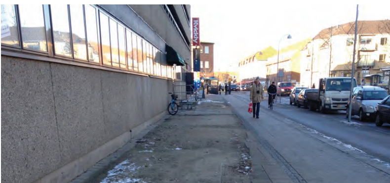
Oversete steder I, Fra ingenmandsland til allemandsliv. borgerinvolverende kunstinstitution produceret med lokale unge ml. 16-21 år fra Hvidovre Produktionsskole's 6 forskellige afdelinger til Vestegnens Kulturuge. Anvendt i 3 måneder af lokale børnehaver. Materiale: bannere, træ, maling, spraymaling, rullegræs. Støttet af Hvidovre Kommune og Statens Kunstfond. Projekt: http://allemandsliv.blogspot.dk